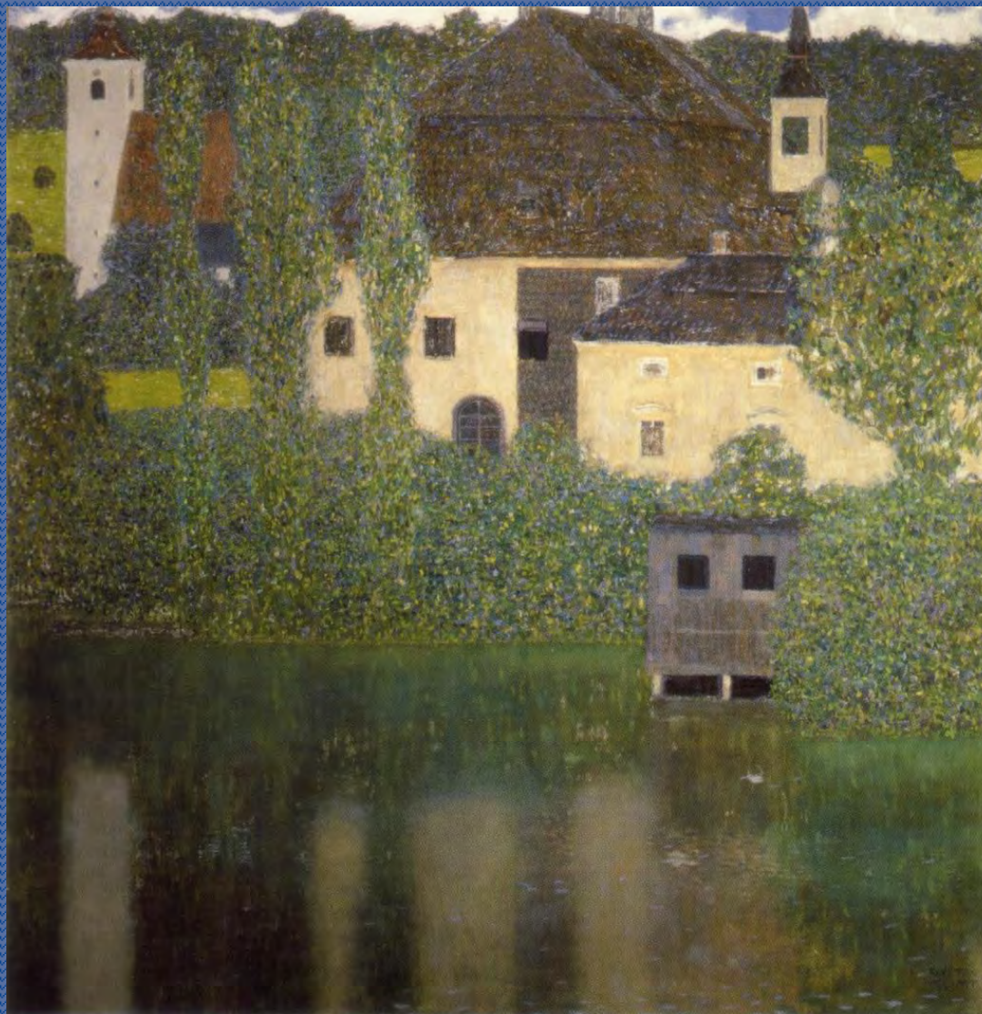
Gustav Klimt muri sull'acqua