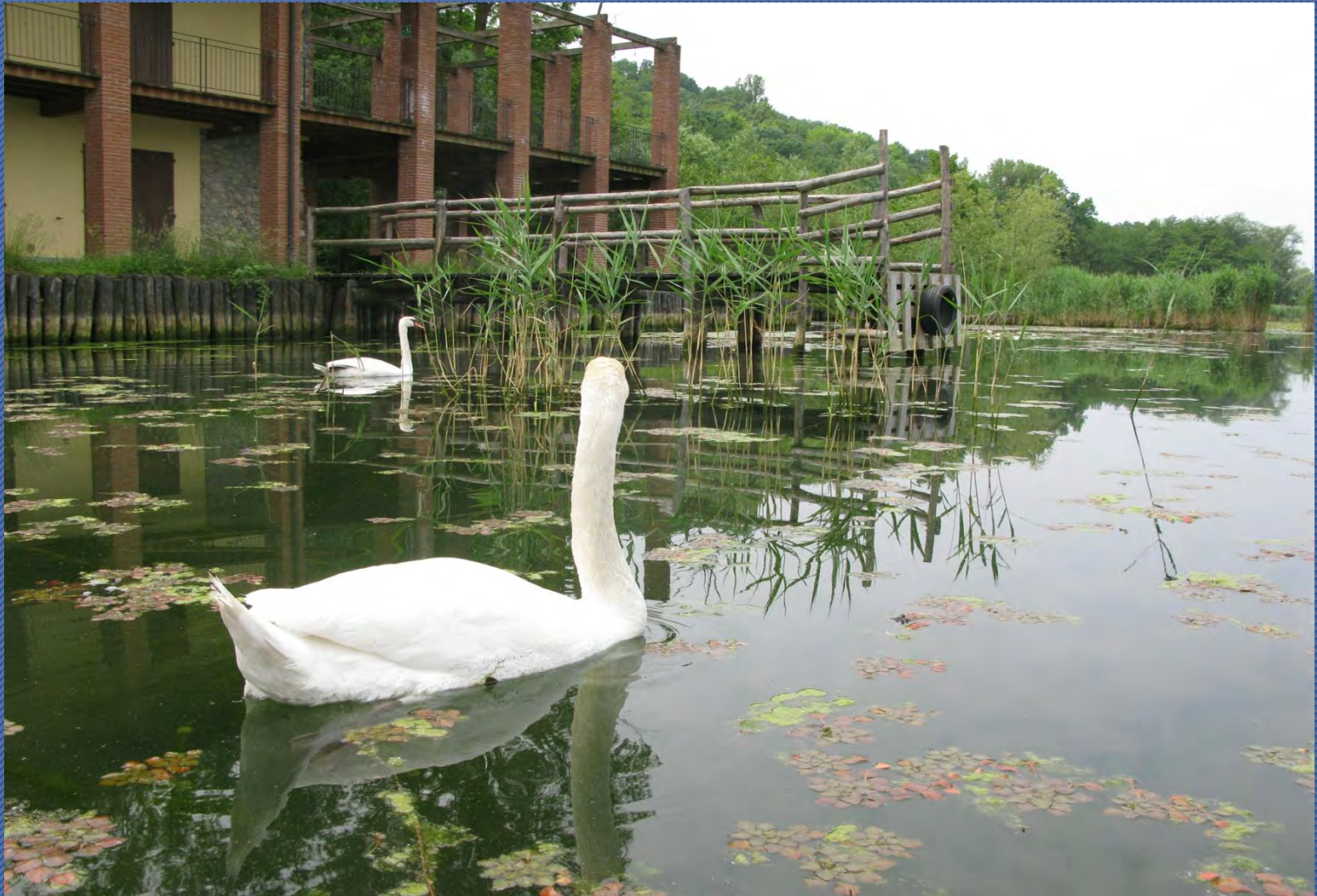
• Lago di Alserio, Casin al Lago