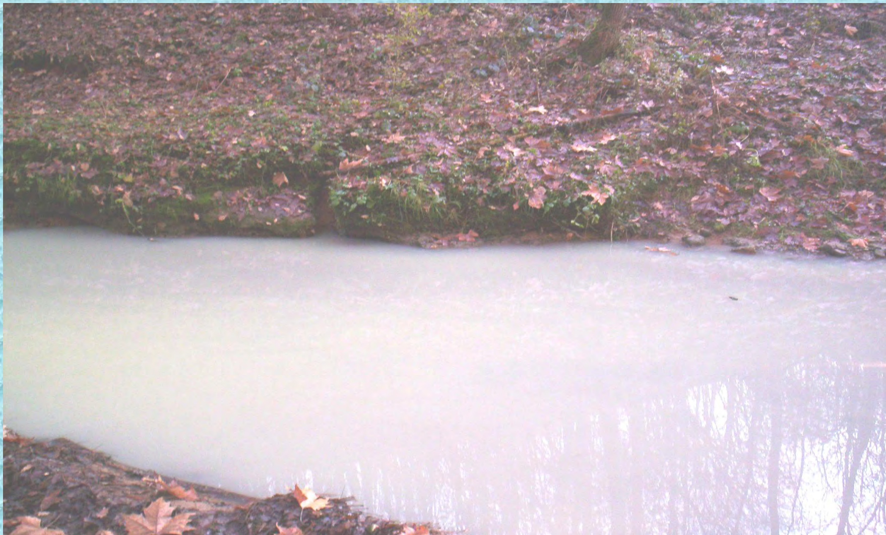
Marzo 2008 - Torrente Pegorino (SIC) sotto il lavatoio di Correzzana