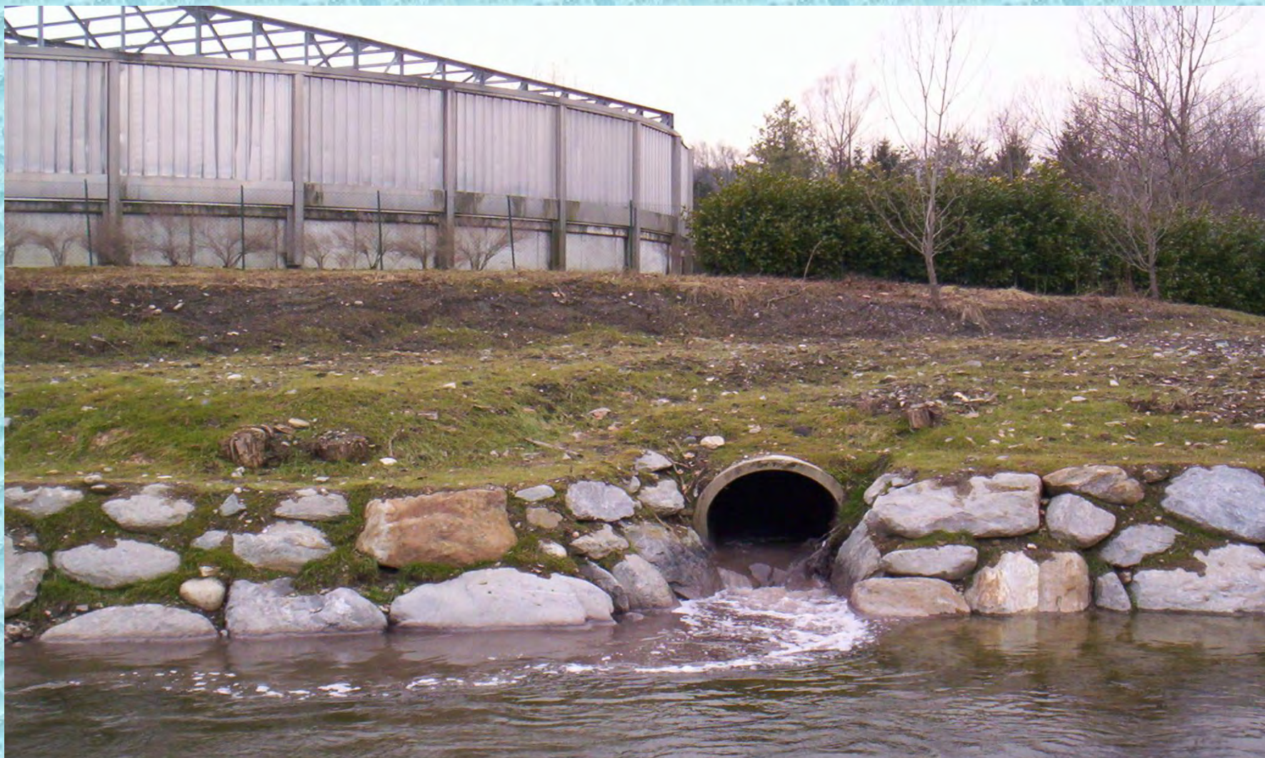
Bay – Pass dell’Impianto di Depurazione a Baggero di Merone