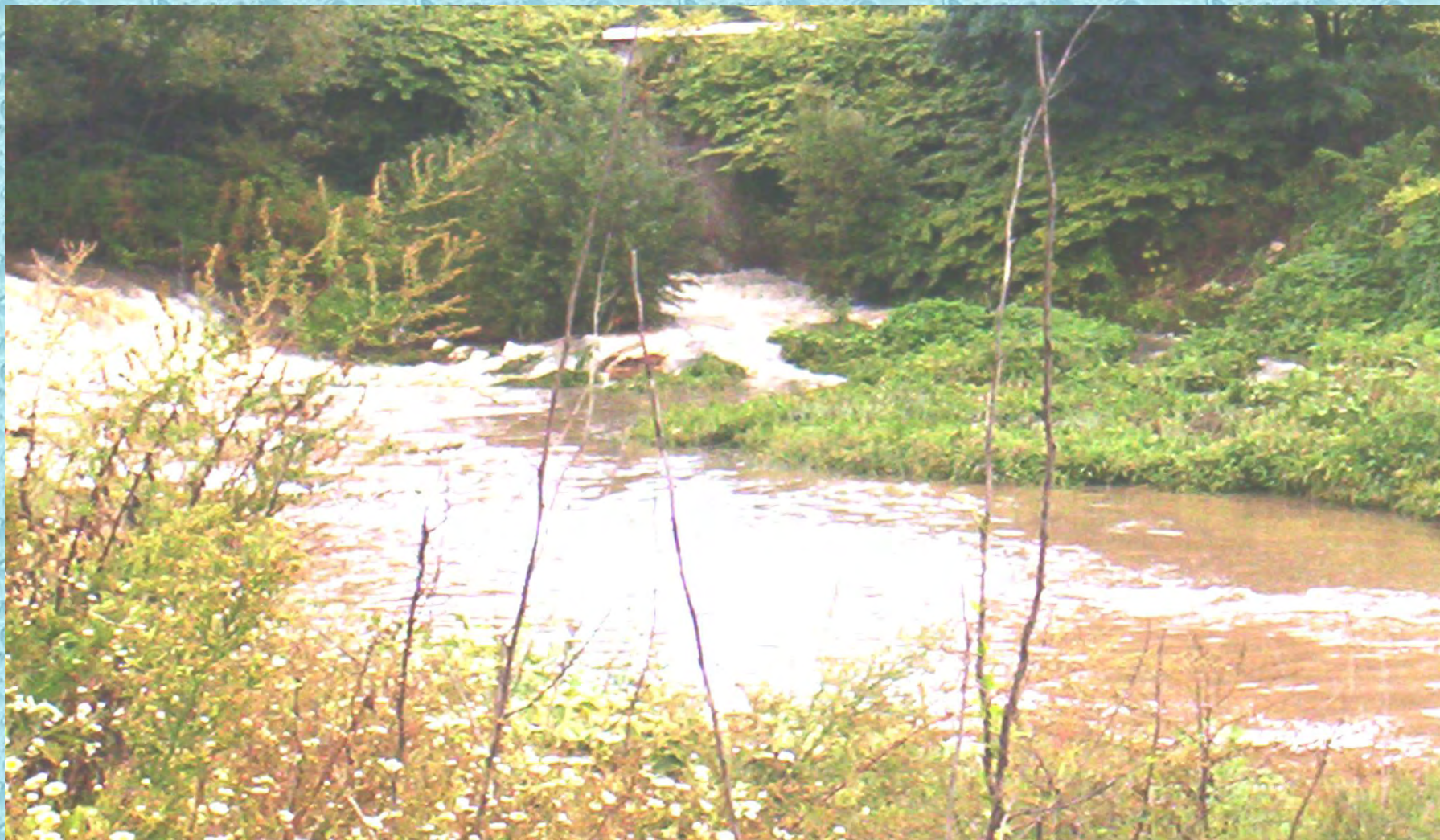
Villasanta - Sfioratore di piena consortile N° 6 a valle della briglia di S.Giorgio di Biassono